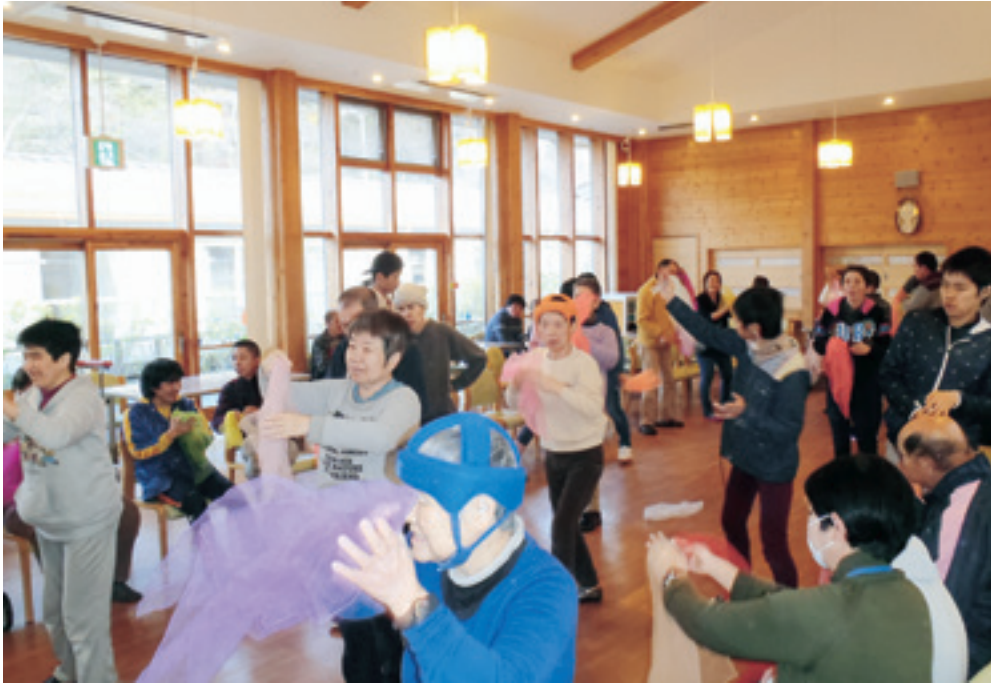
福祉レクリエーションのーコマ：食堂にて