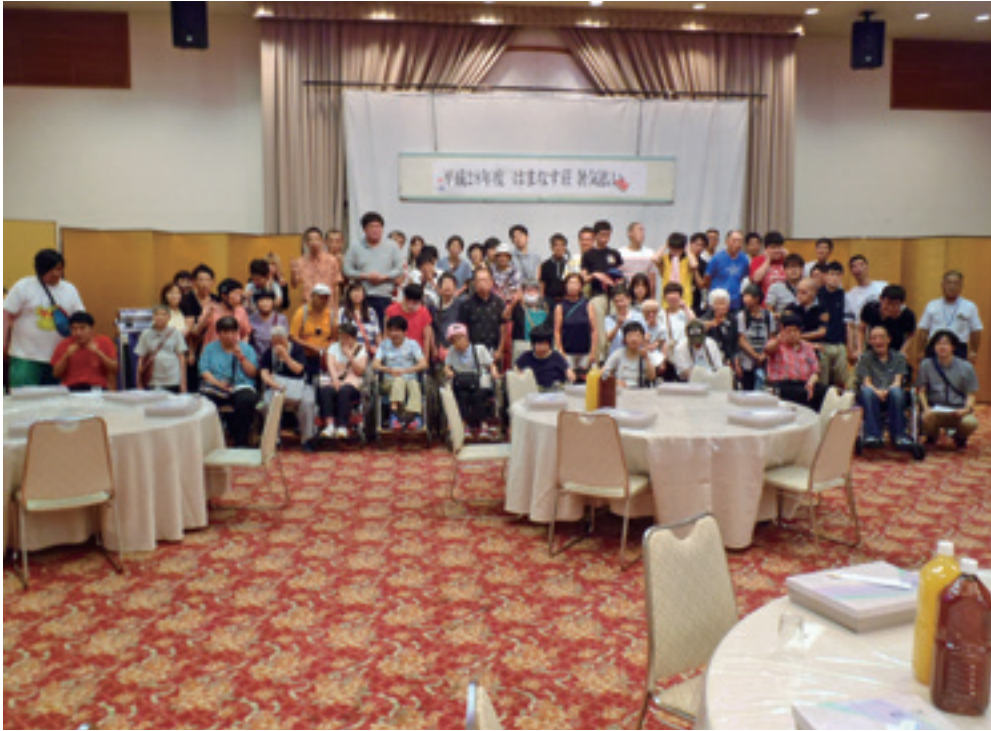
暑気払いのひとこま