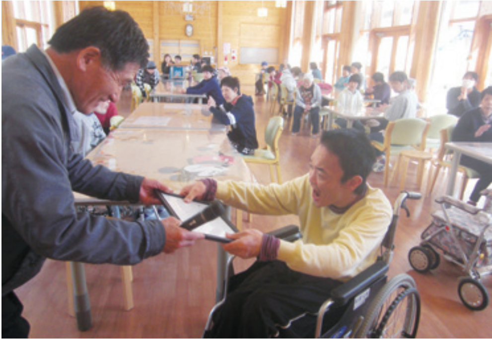
功労賞のひとこま