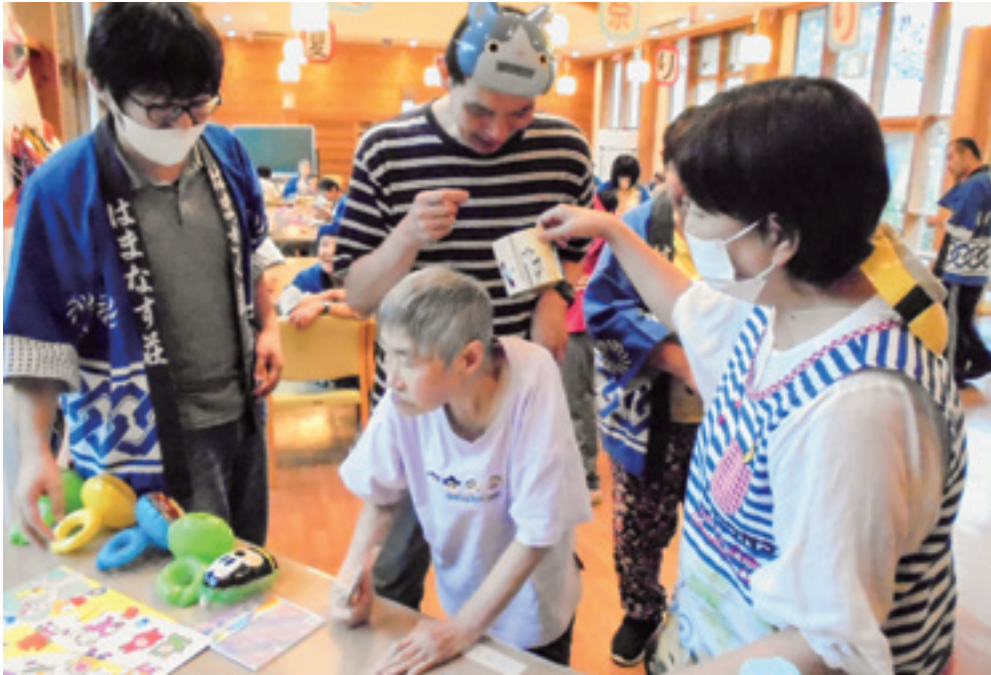
はまなす荘の夏祭り