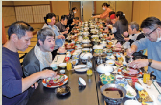
グループ旅行 2班 母畑温泉