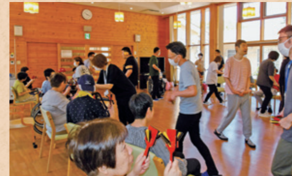
春のふれあいレクリエーション