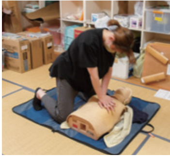
「いのちをつなぐ力」を学ぶ—真剣なまなざしで心肺蘇生法を実践中

命を救うための技術は、特別な資格を持つ人だけのものではなく、誰にでも身に付けられる「いのちをつなぐ力」