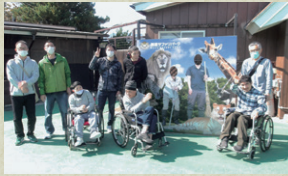
グループ旅行 1班 那須サファリパーク