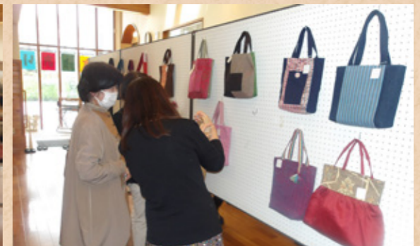
さきおり展示即売会